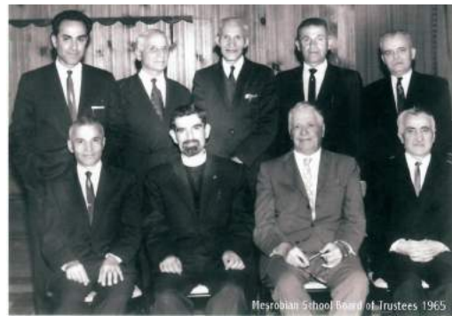
Mesrobian School Board of Trustees 1965